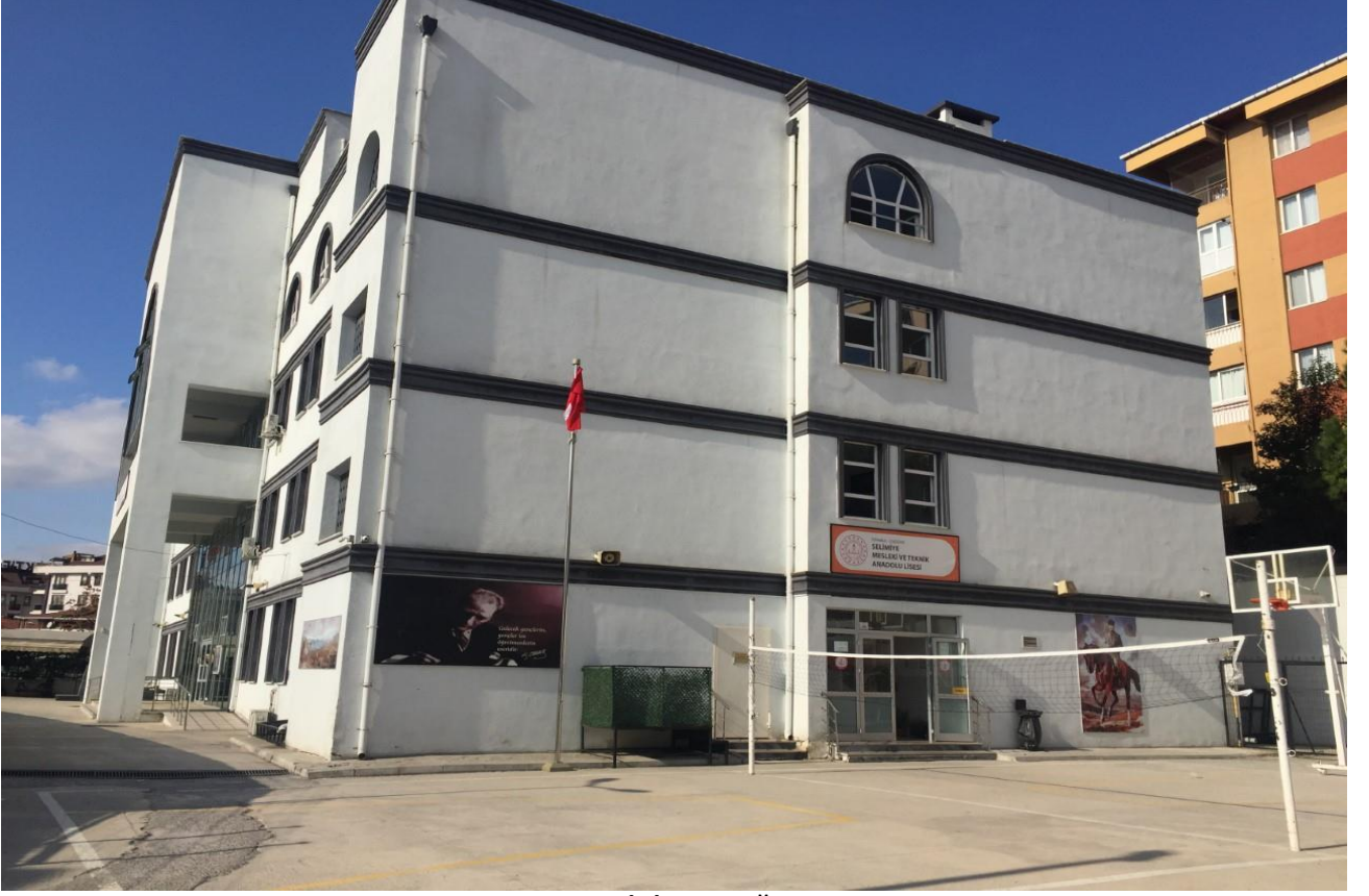
OKUL GİRİŞ FOTOĞRAFI